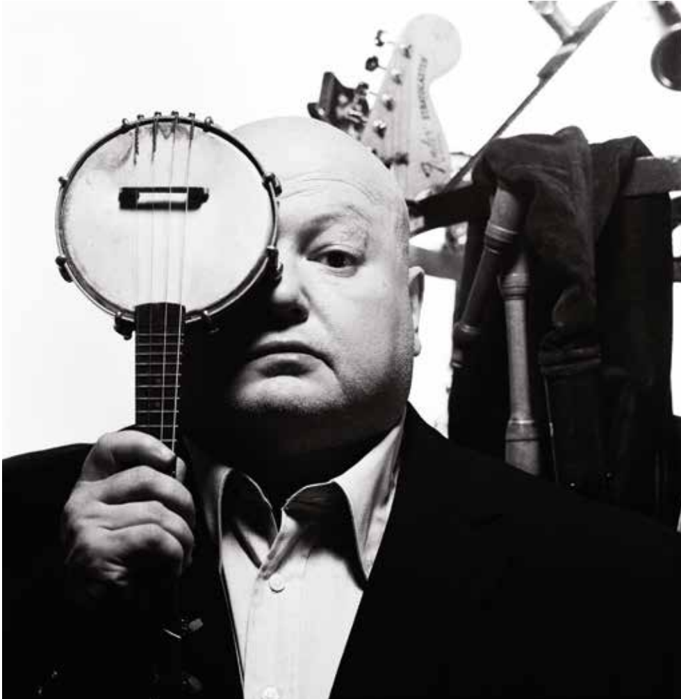
Pigalle en concert au théâtre du Familistère le samedi 15 février 2014 à 20h30

La saison 2013 / 2014 du théâtre du Familistère est organisée par le syndicat mixte du Familistère Godin et la régie du Familistère avec le concours de Sans arrêt sans limites. La saison 2013 / 2014 du théâtre du Familistère de Guise est soutenue par le Département de l'Aisne, la ville de Guise et la Caisse des Dépôts et Consignations.