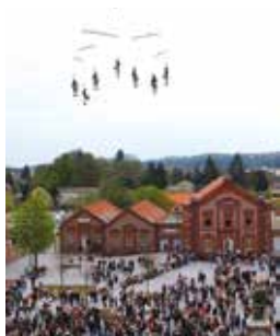
Transe Express, 1 er mai 2013

ARTS DE LA RUE RENCONTRES VISITES PROJECTIONS EXPOSITIONS