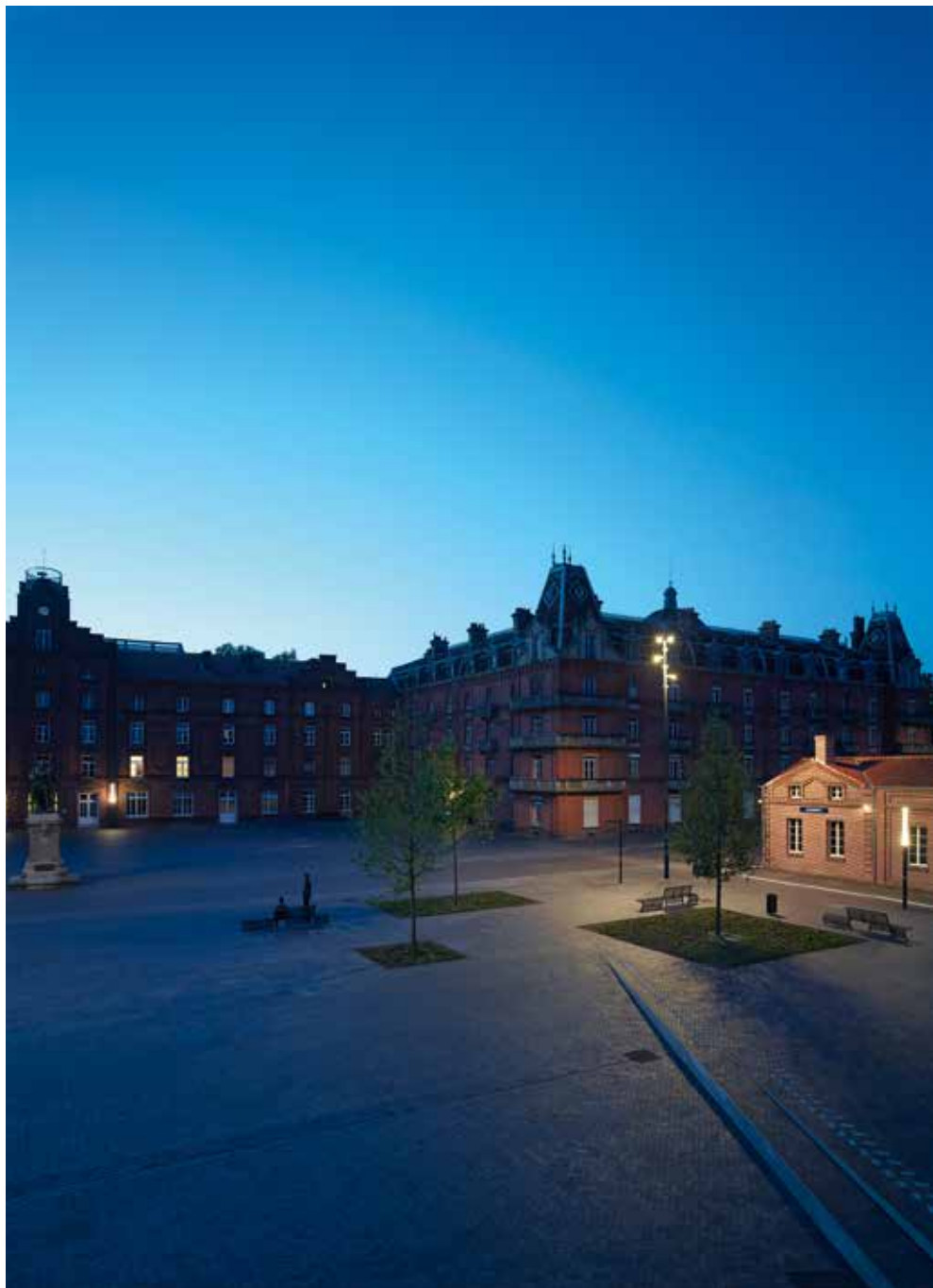
La place du Familistère vue du foyer du théâtre, juillet 2013