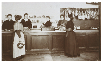
Le comptoir de boucherie et de charcuterie des éconômats du Familistère.