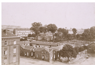
Les éconômats du Familistère vus du belvédère du pavillon central. vers 1897.