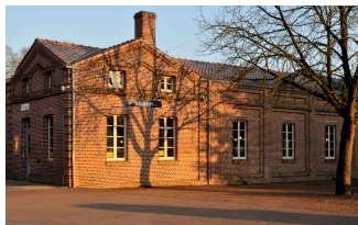
Les éconômats du Familistère. Photographie Hugues Fontaine, 2009.

ACCUEIL DE GUISE DÉCOUVRIR LES ÉCONOMATS UNE ARCHITECTURE AU SERVICE DU PEUPLE LE FAMILISTÈRE