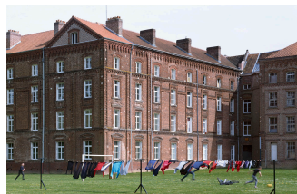
Le fil à linge du Palais social. Photographie Georges Fessy, 2016.

ACCUEIL DÉCOUVRIR RÉGÉNÉRER LE FAMILISTÈRE : LE PROGRAMME UTOPIA UN MUSÉE DE SITE HABITÉ