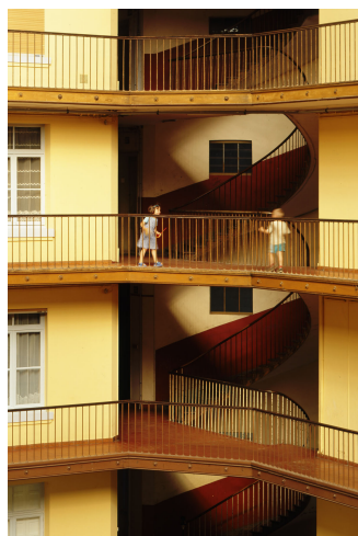
Dans la cour de l'aile