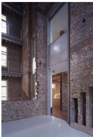
La coupe grandeur nature du pavillon central. Photographie Georges Fessy, 2010.