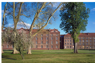
Le Palais social vu du jardin de la presqu'île. Photographie Georges Fessy, 2016.