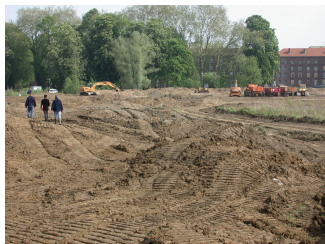
Chantier du jardin de la presqu'île. Photographie Familistère de Guise, 2004.