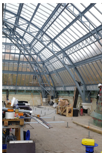
Restauration de la verrière de l'aile gauche du Palais social.