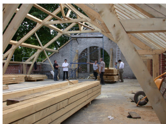
Chantier de la buanderie-piscine. Photographie Familistère de Guise, 2005.

sur les édifices étaient multiples : remplacement des tuiles de couverture par des ardoises, installation de tôles de plastique sur les verrières des cours intérieures du Palais social, suppression des pavés de verre des coursives de l'aile gauche, effacement des châssis d'éclairage zénithal de la salle du théâtre, constructions adventives dans les économats, la buanderie-piscine ou le théâtre, pose de fenêtres disgracieuses et de volets roulants, changement de couleurs de peintures dans les cours intérieures, etc.