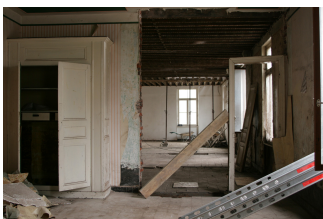
Chantier du pavillon central. Photographie Familistère de Guise, 2009