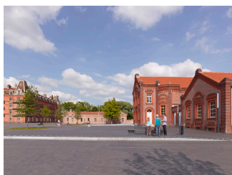
La place du Familistère devant le théâtre. Photographie Stéphane Chalmeau, 2013.

être le prisonnier d'une présentation pédagogiquement contraignante, sa pensée pouvant glisser sur des graphes comme être relancée par des objets [...] ». L'auteur ajoute pour conclure : « Il y a des lieux qui sont justes, laissant au visiteur, le soin de pousser lui-même comme il l'entend le curseur de la mémoire ».