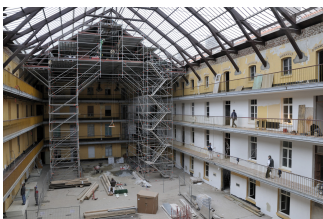
Chantier du pavillon central.