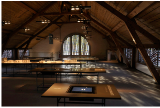
Le séchoir de la buanderie-piscine. Photographie Hugues Fontaine, 2009.