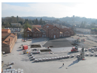
Chantier de la place du Familistère.