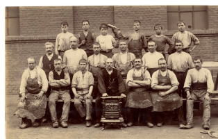
Un groupe d'ouvriers de l'atelier d'ajustage de