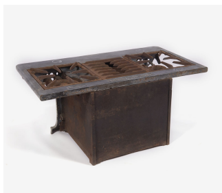
Réchaud à gaz n° 140 « Le Furnus ». Usines et Fonderies Arthur Martin, modèle vers 1928. Image avant restauration. Collection Familistère de Guise (inv. n° 2017-4-20).

recherche d'un plus grand confort dans l'espace domestique et dans l'accomplissement des activités ménagères. Ce phénomène transparait lors du Salon des Arts Ménagers dont la première édition s'ouvre à Paris en 1923. Le gaz manufacturé est présenté comme plus économique, plus hygiénique et plus commode d'utilisation que le charbon. Les Fonderies Arthur Martin développent rapidement toute une gamme de produits fonctionnant au gaz : réchauds, rôtissoires, réchauds pour le travail en atelier (chapeliers, repasseuses, etc.), cuisinières, radiateurs, cheminées et calorifères. Deux catalogues publiés en 1910, sont entièrement dédiés aux appareils de cuisson et de chauffage au gaz. Dans l'album de 1928, le groupe, qui se qualifie « [d'] arbitres du Confort Moderne », invite sa clientèle à adopter « toute la cuisine par le gaz ». La note introductive décline toutes les qualités de ce combustible : « facilité d'installation, mise en service à tous moments, rapidité de cuisson et marche silencieuse, propreté absolue, pas de cendres, pas de foyers à décrasser, pas de fumées, pas de stocks encombrants en bois et en charbon, contrôle de la dépense immédiatement, réglage précis et instantané, faible capacité d'encombrement. Plus de cuisines surchauffées. ». À la même période, la Société du Familistère présente, dans une moindre mesure, une section dédiée aux appareils à gaz dans son catalogue général.