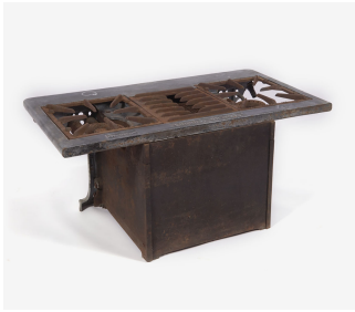
Réchaud à gaz n° 140 « Le Furnus ». Usines et Fonderies Arthur Martin, modèle vers 1928. Image avant restauration. Collection Familistère de Guise (inv. n° 2017-4-20).

recherche d'un plus grand confort dans l'espace domestique et dans l'accomplissement des activités ménagères. Ce phénomène transparait lors du Salon des Arts Ménagers dont la première édition s'ouvre à Paris en 1923. Le gaz manufacturé est présenté comme plus économique, plus hygiénique et plus commode d'utilisation que le charbon. Les Fonderies Arthur Martin développent rapidement toute une gamme de produits fonctionnant au gaz : réchauds, rôtissoires, réchauds pour le travail en atelier (chapeliers, repasseuses, etc.), cuisinières, radiateurs, cheminées et calorifères. Deux catalogues publiés en 1910, sont entièrement dédiés aux appareils de cuisson et de chauffage au gaz. Dans l'album de 1928, le groupe, qui se qualifie « [d'] arbitres du Confort Moderne », invite sa clientèle à adopter « toute la cuisine par le gaz ». La note introductive décline toutes les qualités de ce combustible : « facilité d'installation, mise en service à tous moments, rapidité de cuisson et marche silencieuse, propreté absolue, pas de cendres, pas de foyers à décrasser, pas de fumées, pas de stocks encombrants en bois et en charbon, contrôle de la dépense immédiatement, réglage précis et instantané, faible capacité d'encombrement. Plus de cuisines surchauffées. ». À la même période, la Société du Familistère présente, dans une moindre mesure, une section dédiée aux appareils à gaz dans son catalogue général.