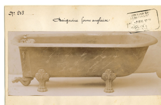
modèle n° 258 d'une baignoire de forme anglaise