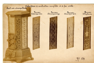
Modèle n° 159 de calorifères à combustion complète et à feu visible