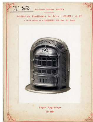
modèle n° 360 du foyer hygiénique n° 340