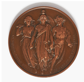
Médaille de bronze de l'Exposition régionale de 1859 à Rouen