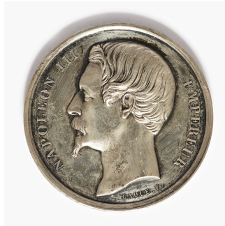
Médaille d'argent de l'Exposition industrielle de 1859 à Bordeaux