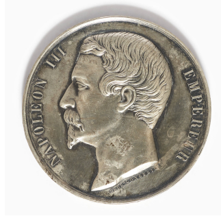
Médaille d'argent de l'exposition agricole, horticole et industrielle de 1861 à Châlons-sur-Marne

Notice créée le 20/05/2019. Dernière modification le 22/05/2019.