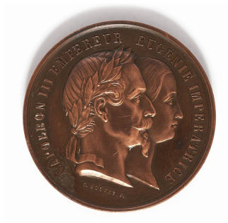
Médaille de bronze de l'Exposition universelle de 1861 à Metz