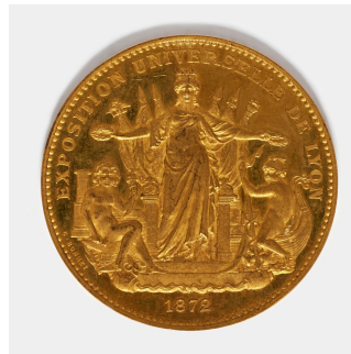
Médaille d'or de l'Exposition universelle de 1872 à Lyon