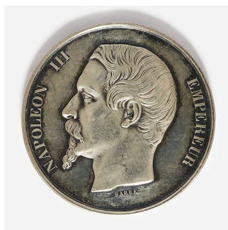
Médaille d'argent du concours régional et des expositions de 1860 à Montpellier