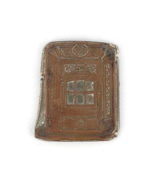
Matrice de gravure : Foyer hygiénique n° 2346