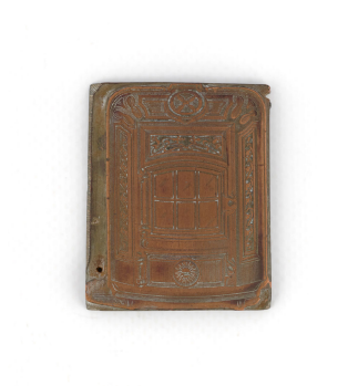
Matrice de gravure : Foyer hygiénique n° 2346