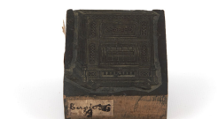
Matrice de gravure : Calorifère de salle à manger n° 9