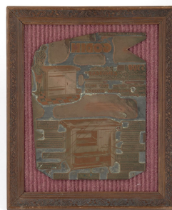
Matrice de gravure : Circulaire Godin n° 3415-59 A « Cuisinière n° 5300 »