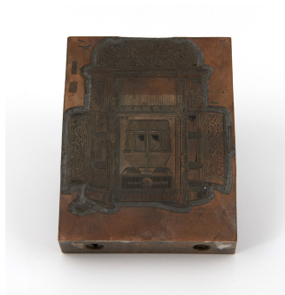
Matrice de gravure : Calorifère-buffet à feu intermittent n° 31-33