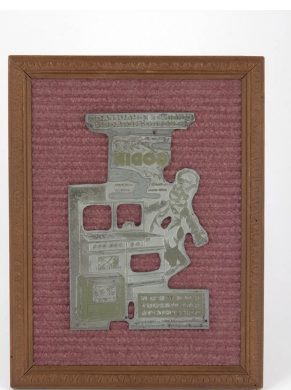
Matrice de gravure : Affichette publicitaire Godin « Cuisine-Chauffage. Électro-ménager »