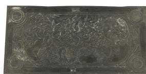
Matrice de gravure : Ornement végétal