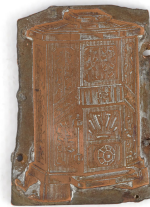
Matrice de gravure : Foyer hygiénique « Godinette » n° 400