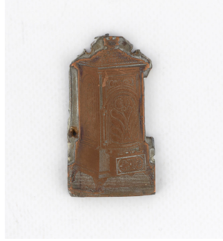
Matrice de gravure : Calorifère n° 2130 à dessus cloche