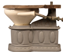
Appareil inodore à socle orné avec effet d'eau

Notice créée le 18/10/2018. Dernière modification le 08/11/2018.