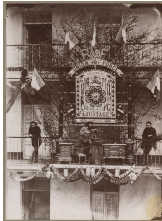
Le trophée de l'atelier d'ajustage de l'usine du Familistère