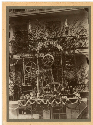
Le trophée de l'atelier du matériel de l'usine du Familistère