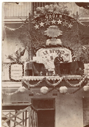
Le trophée du Devoir, le journal du Familistère