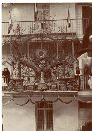
Le trophée de l'atelier d'emballage et de magasinage de l'usine du Familistère