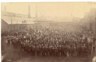
Le personnel de l'usine du Familistère de Guise

appareil de chauffage ; portrait ; enfant ; ouvrier ; femme ; homme ; usine ; Familistère de Laeken