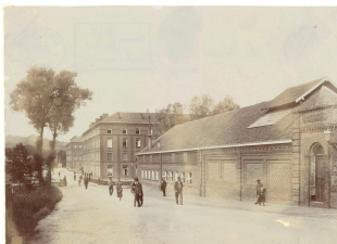
La buanderie-piscine du Familistère

Notice créée le 09/10/2018. Dernière modification le 08/11/2018.