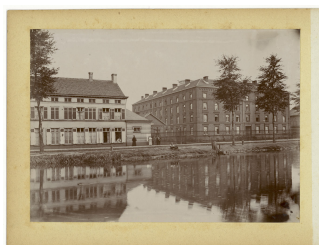
Le Familistère de Laeken au bord du canal de Willebroek