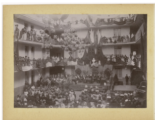
La fête de l'Enfance au Familistère de Laeken