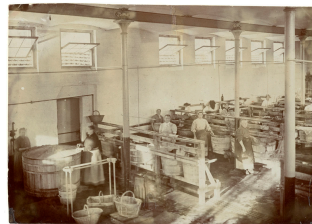
La buanderie du Familistère