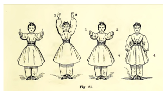
Figure n° 23 du Traité élémentaire de gymnastique classique avec chants notés, à l'usage des enfants des deux sexes , de Napoléon Laisné (Paris, Librairie de L. Hachette et C ie , [1867], p. 43). Londres, Welcome Library (Internet Archive).

La photographie montre deux classes sous la verrière qui recouvre le préau des écoles situé à l'est du théâtre. Les portes visibles sur la gauche