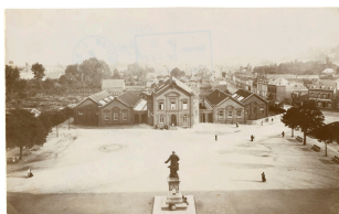
La place du Familistère vue du pavillon central du Palais social

Notice créée le 17/07/2018. Dernière modification le 27/08/2022.