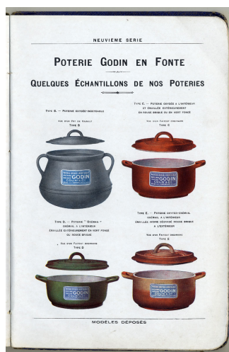
Les poteries en fonte émaillée dans l'album de reconstitution de 1922 de la Société du Familistère.