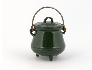
Pot de Hainaut jouet

(inv. n° 2007-13-17).