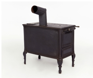
Cuisinière jouet n° 4. Société du Familistère de Guise, modèle de 1887. Collection Familistère de Guise (inv. n° 2006-7-1).