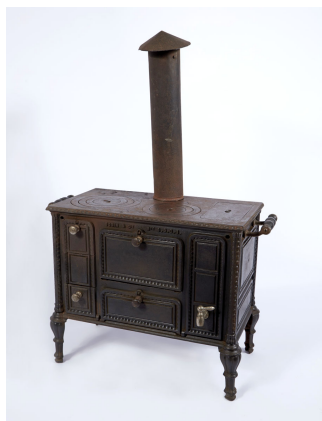
Cuisinière jouet n° 4

Les cuisinières n° 282 à 286 dans l'album de 1887 de la Société du Familistère. Collection Familistère de Guise (inv. n° 1999-9-78).