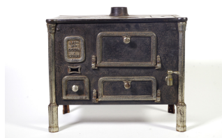
Cuisinière jouet n° 7