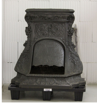
Cheminée n° 19

Notice créée le 27/04/2020. Dernière modification le 10/06/2020.