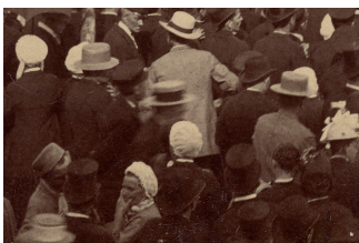
Cérémonie d'inauguration du monument à Godin sur la place du Familistère. Photographie anonyme, 1889. Collection Familistère de Guise (inv. n° 1976-1-324).