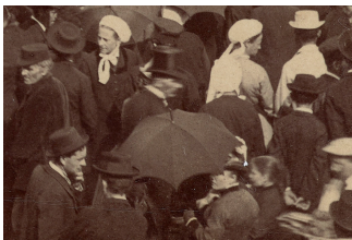
Cérémonie d'inauguration du monument à Godin sur la place du Familistère. Photographie anonyme, 1889. Collection Familistère de Guise (inv. n° 1976-1-324).