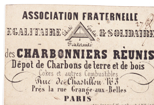
Carte de l'Association fraternelle, égalitaire et solidaire des charbonniers réunis