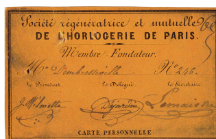
Carte de membre fondateur de la Société régénératrice et mutuelle de l'horlogerie de Paris