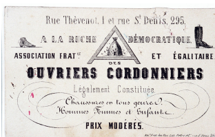
Carte de l'Association fraternelle et égalitaire des ouvriers cordonniers « À la ruche démocratique »