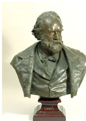
Portrait de Jean-Baptiste André Godin

Notice créée le 09/06/2020. Dernière modification le 10/06/2020.