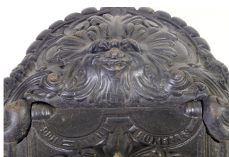
Bac à charbon n° 3 B (détail). Société du Familistère de Guise Godin & C ie , modèle de 1880. Collection Familistère de Guise (inv. n° 2012-6-2).