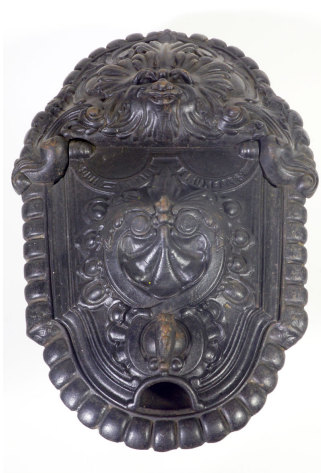
Bac à charbon n° 3 B. Société du Familistère de Guise Godin & C ie , modèle de 1880. Collection Familistère de Guise (inv. n° 2012-6-2).