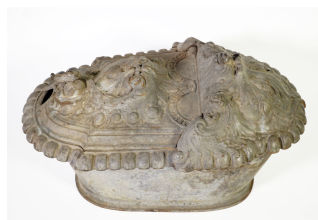
Bac à charbon n° 4