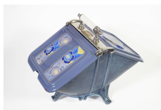
Bac à charbon n° 7

Notice créée le 04/05/2018. Dernière modification le 19/06/2018.