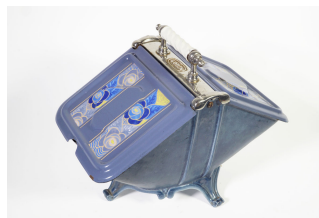
Bac à charbon n° 7

Notice créée le 04/05/2018. Dernière modification le 19/06/2018.