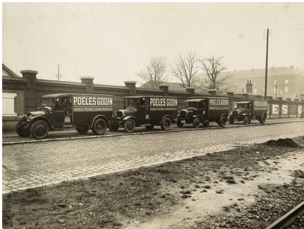
Camions de livraison de la Société du Familistère devant l'usine et le Familistère de Laeken.