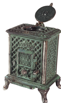
Encrrier « Radiolette » n° 16