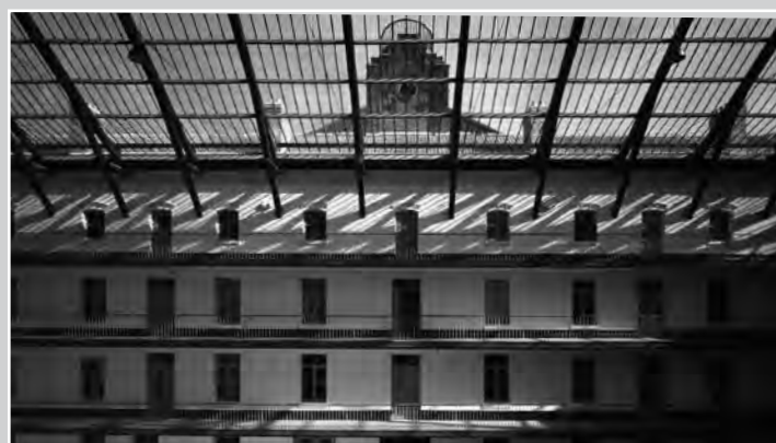
Cour du pavillon central