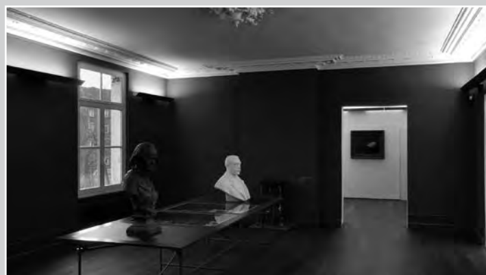
Appartement de Godin