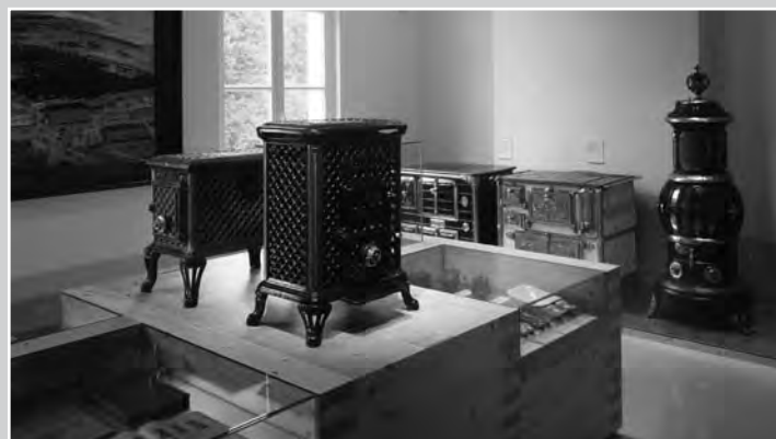
Exposition pavillon central